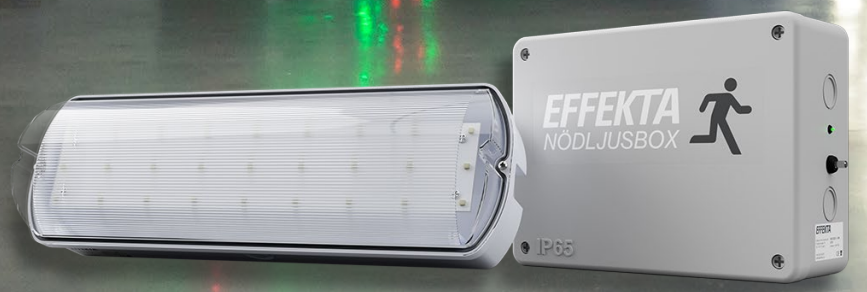
NoviLed II (AT-E) med extern elektronikbox