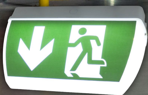
Dubbelsidig kåpa 30m läsavstånd