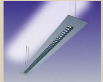
SLIMLUX-B HAR BÅDE UPP- OCH NEDLJUS. 2-RÖRS ARMATUR/TVÄRLAMELL-BLÄNDSKYDD