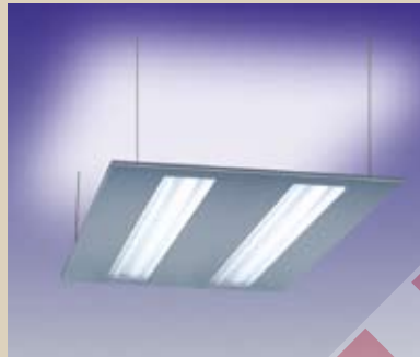
SLIMLUX-C HAR BÅDE UPP- OCH NEDLJUS. 4-RÖRS ARMATUR/OPALVITT BLÄNDSKYDD