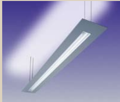
SLIMLUX-A HAR BÅDE UPP- OCH NEDLJUS. 2-RÖRS ARMATUR/OPALVITT BLÄNDSKYDD

På vajerpendel. Armaturen är försedd med fyra lätt inställbara hållare för justering av pendellängd. Levereras med fyra 0,8 m långa stålvajerpendlar samt takkopp.