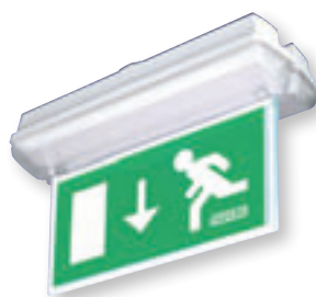
Underhängande skylt inkl armatur har totalhöjd 242 mm