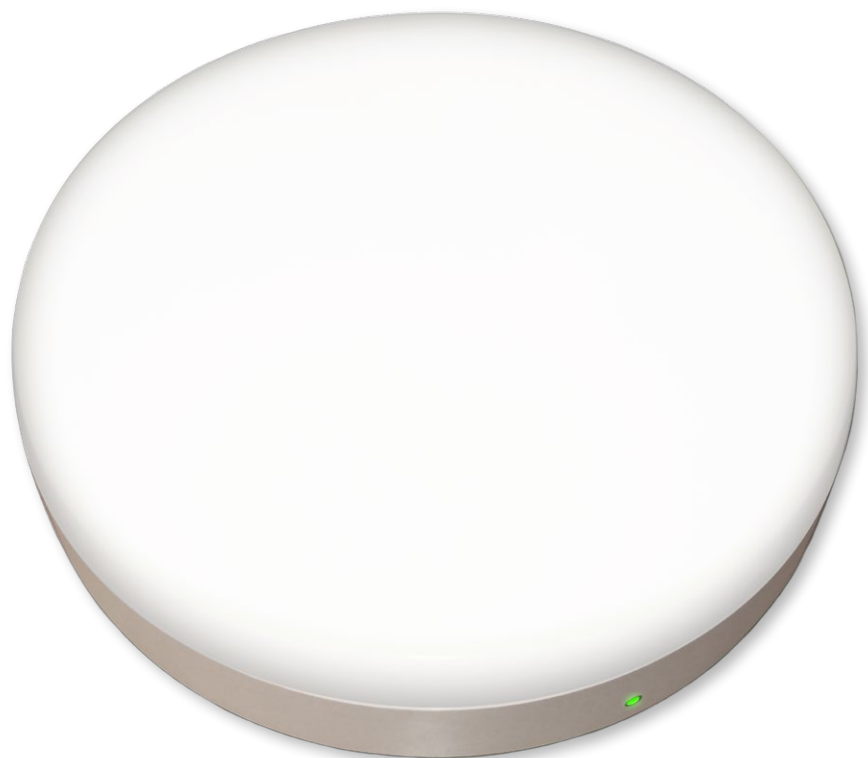
Mått (mm) 1500lm/3000lm: